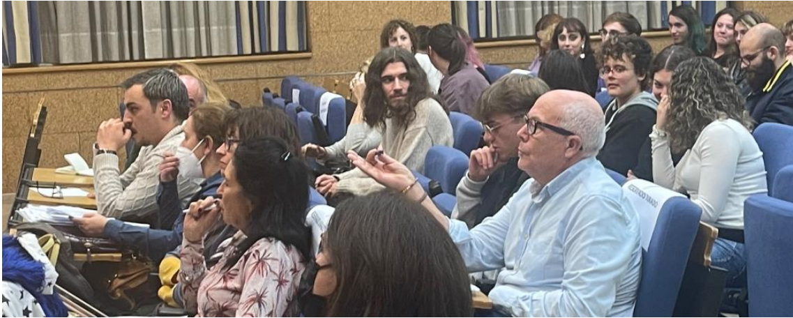
Uno de los momentos donde el público interactúa con los participantes