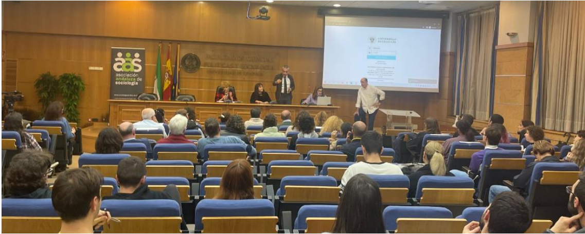
Comienza el acto.....