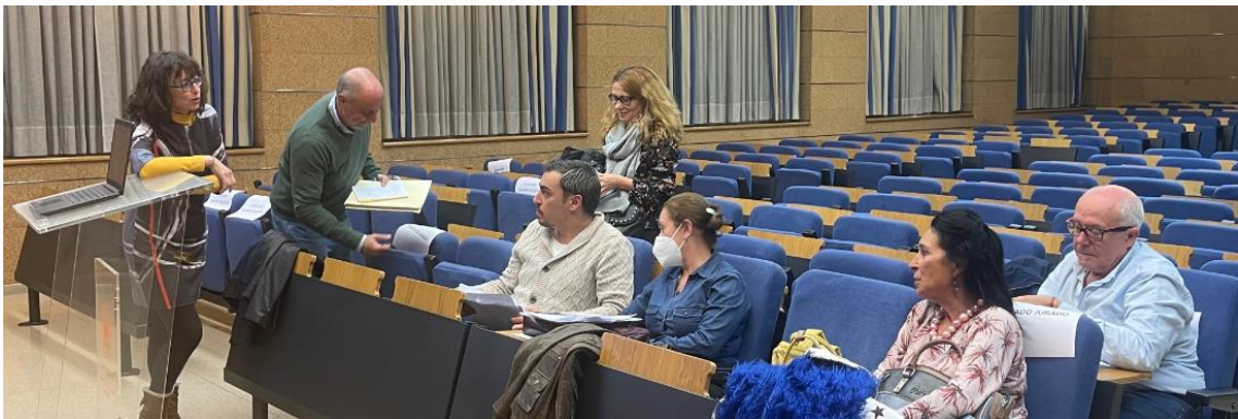
Y el jurado delibera