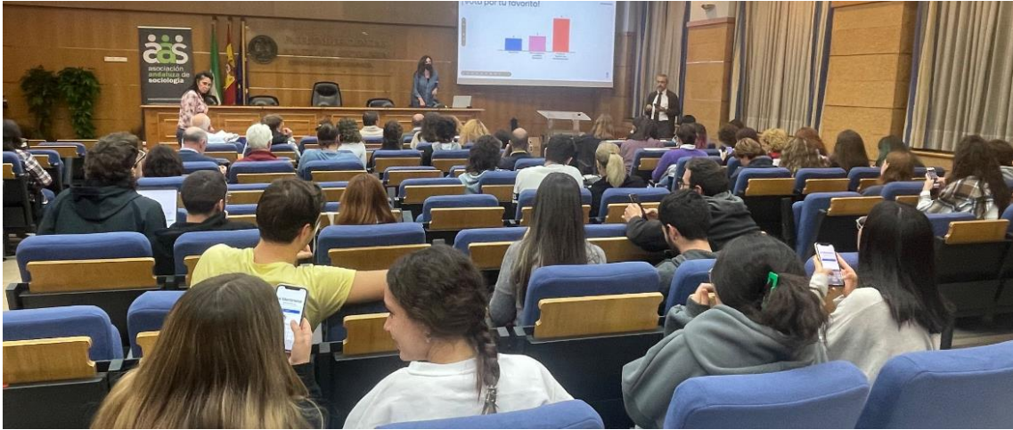
Vota el público