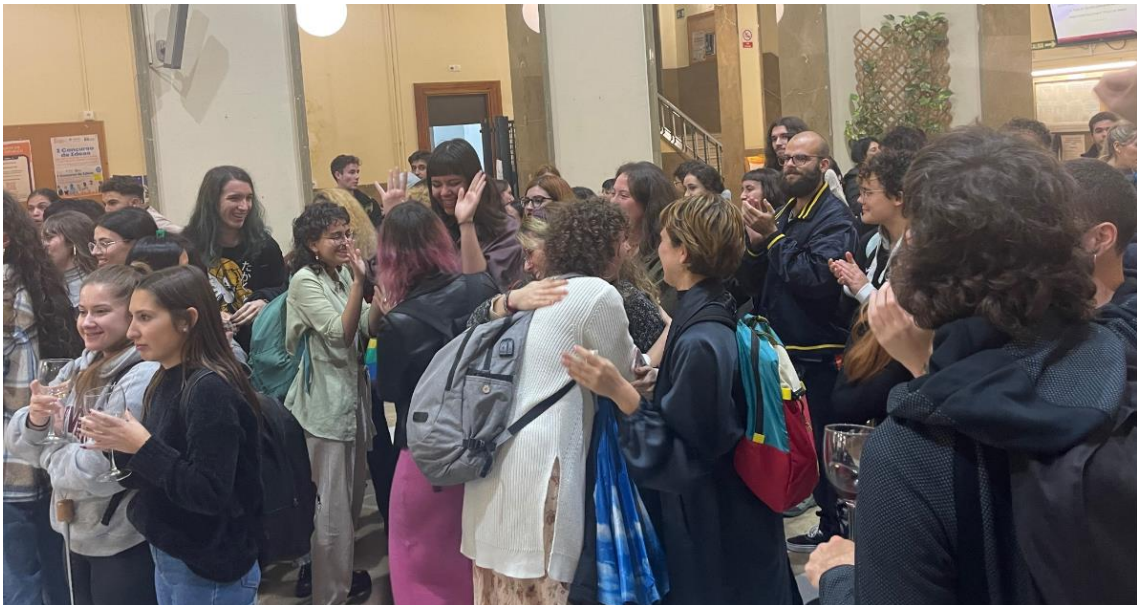
Finalmente se comunica la deliberación del jurado